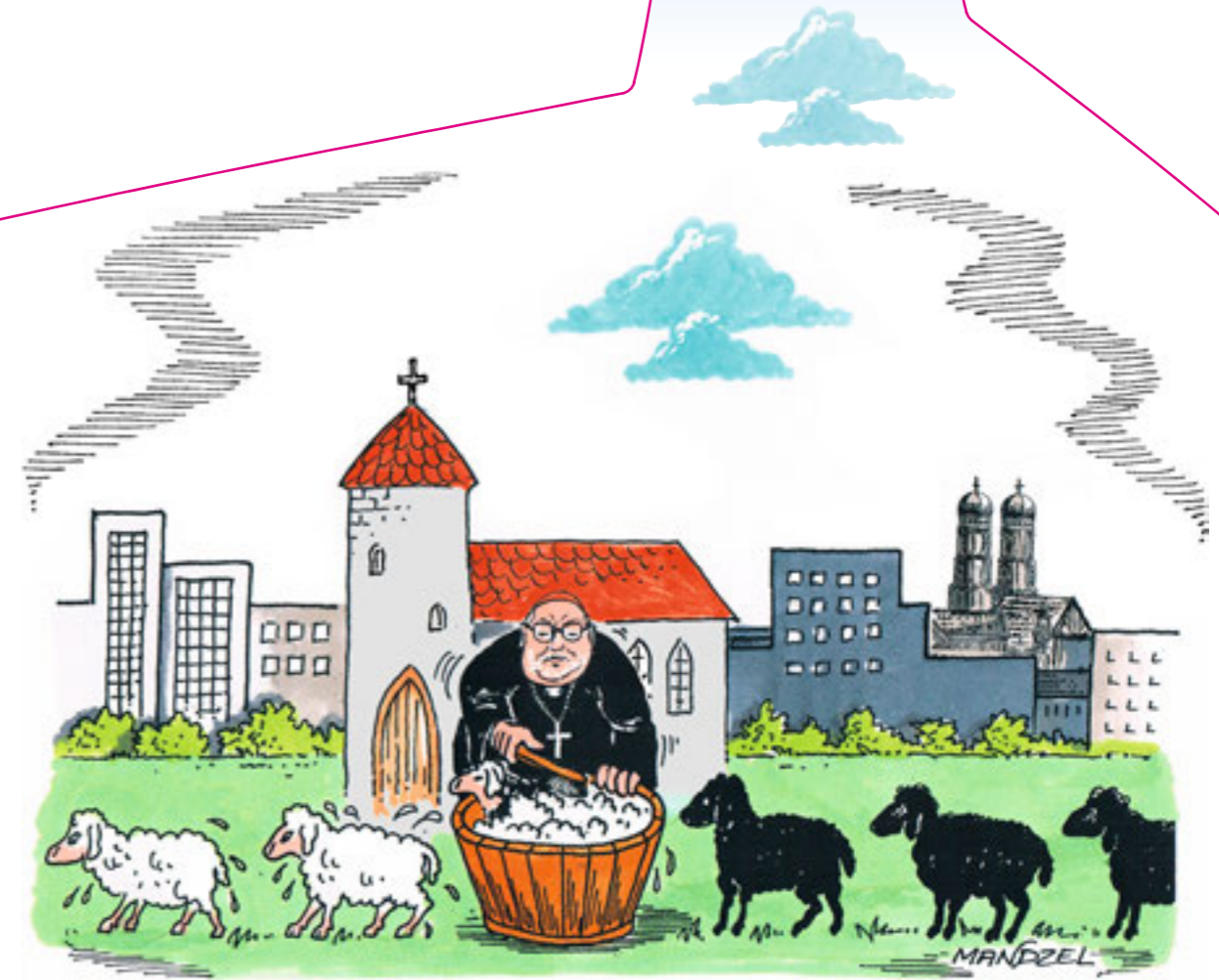
DER NEUE OBERHIRTE BEI DER ARBEIT