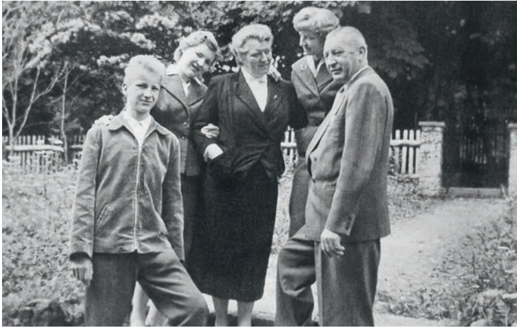
Familienleben: Als Dreizehnjähriger im Kreis meiner Eltern und Schwestern.

uns Kindern später einmal besser gehen sollte. So durfte ich, wenn auch mit sehr überschaubarem Erfolg, Klavier und Geige lernen, obwohl die Jahre nach dem Krieg recht entbehrensreich waren. In den Urlaubsfahren wir nie, aber wir wohnten in einer Region, die zu den schönsten Landschaften zählt, mit dem Hahnenberg, Brunnstein im Blick, mit dem Wilden und dem Zahmen Kaiser, zwei wuchtigen Gebirgsmassiven, die uns mit ihren imposanten Felsformationen beeindruckten.