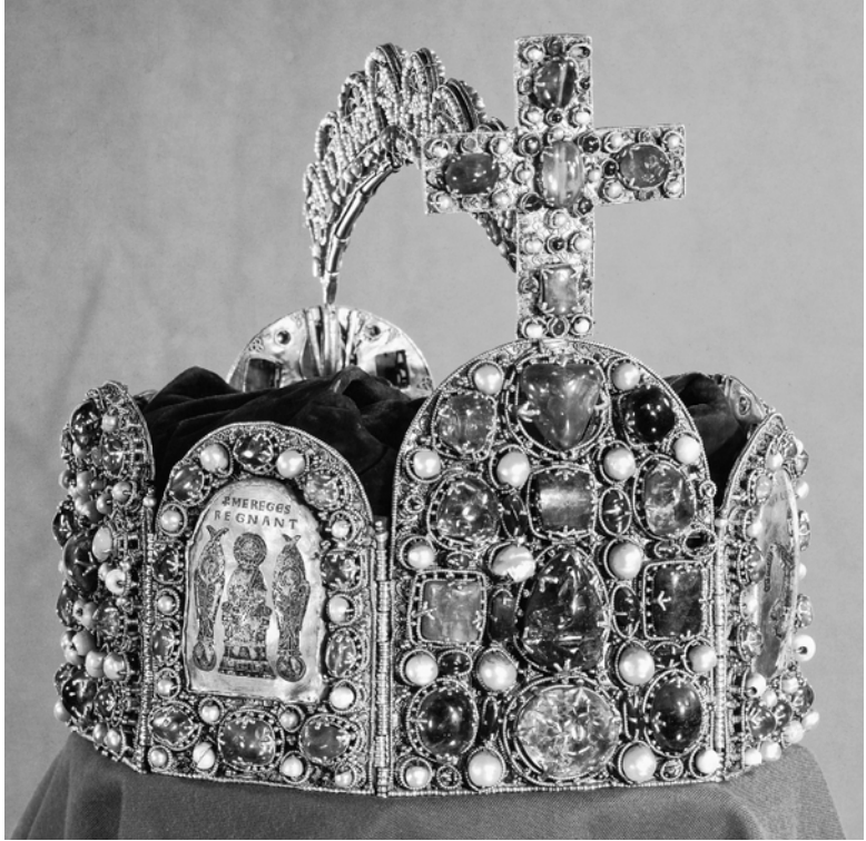
Abbildung 2: Wiener Reichskrone

angebracht ist, die Christus als Weltherrscher zeigt. Bei aller Überhöhung des irdischen Kaisertums, nicht zuletzt durch die als Zeichen der (göttlichen) Herrlichkeit bezeichnete Krone, erinnerte man deren Träger doch vorrangig daran, dass all sein Trachten auch in dem neuen Amt auf das gleiche Ziel ausgerichtet bleiben müsse, das alle Christen verfolgten – auf die Krone des ewigen Lebens. Das Kaisertum blieb freilich die höchste Auszeichnung, die ein Laie im Diesseits erlangen konnte. Otto gewann dadurch zwar wenig reale Macht hinzu, denn das Kaisertum bezog sich nicht auf ein konkret umrissenes Gebiet. Aber ideell stand er nun mit dem Papst als geistlichem Pendant an der Spitze der Christenheit, zu deren Lenkung beide berufen waren, wobei dem Kaiser eben auch die Aufgabe zu-