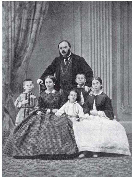
1 Die Familie Della Chiesa (ganz links Giacomo, der spätere Papst)

Der spätere Papst wurde unter dem Namen Giacomo Giovanni Battista Della Chiesa am 21. November 1854 geboren. 1 Er stammte aus einer sehr alten Familie von Markgrafen, die ursprünglich aus Savona kam und schon seit dem späten 13. Jahrhundert in Genua nachweisbar ist. Die Familie zählte seit Jahrhunderten zum alten Stadtpatriziat der großen Seefahrerstadt am Mittelmeer und konnte bereits im 16. Jahrhundert Flottenadmiräle und Senatoren vorweisen. 2 Der Franziskaner Bernardino Della Chiesa (1644–1721), der im frühen 18. Jahrhundert der erste Bischof von Peking gewesen war, nachdem er zuvor dem römischen Mu-