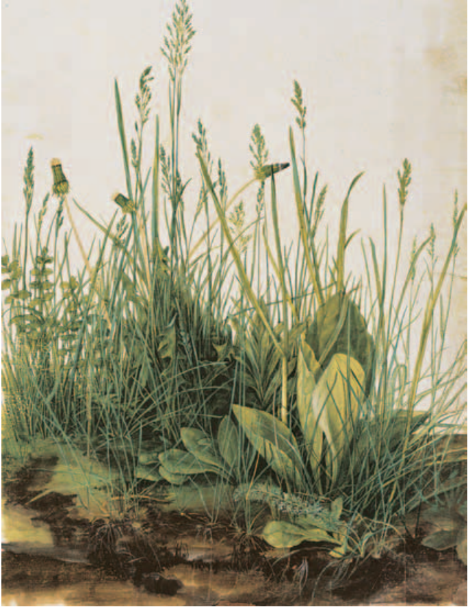
Albrecht Dürer, Das große Rasenstück, 1503