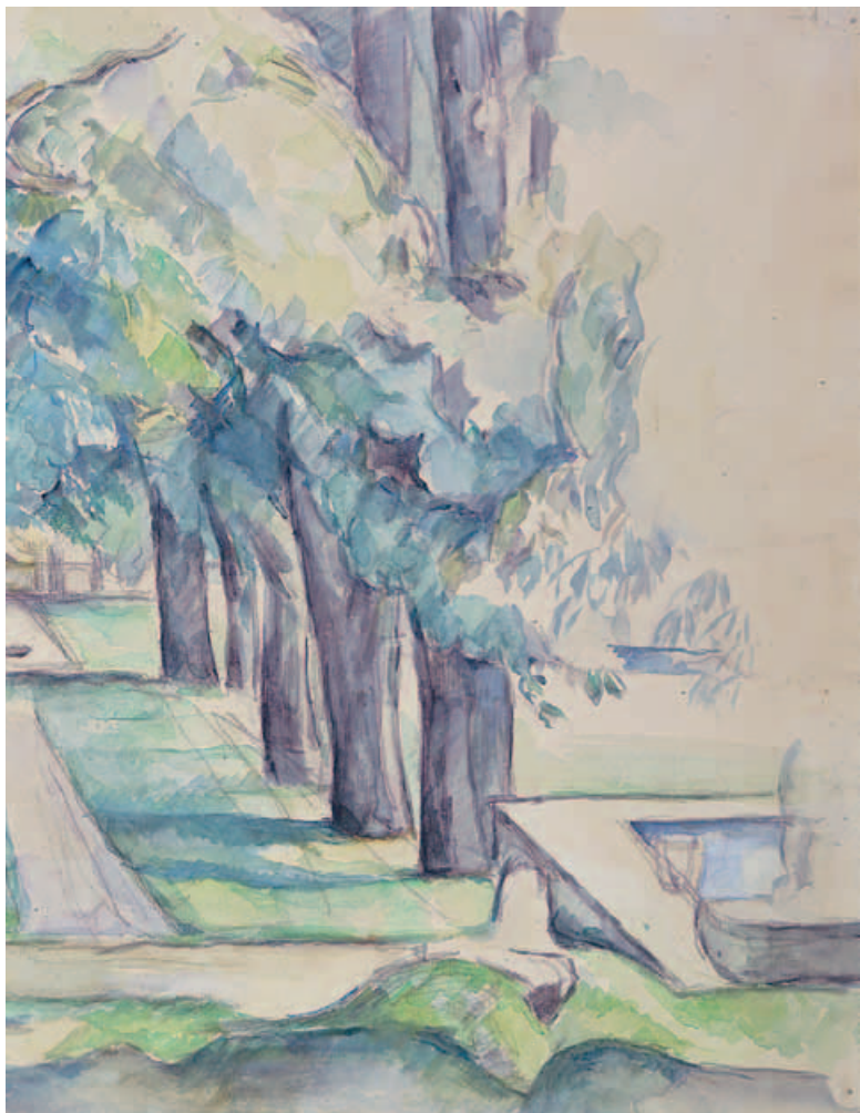
Paul Cézanne, Kastanienallee, o. J.