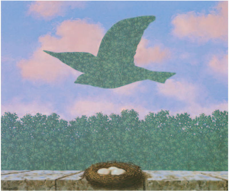
René Magritte, Der Frühling, 1965